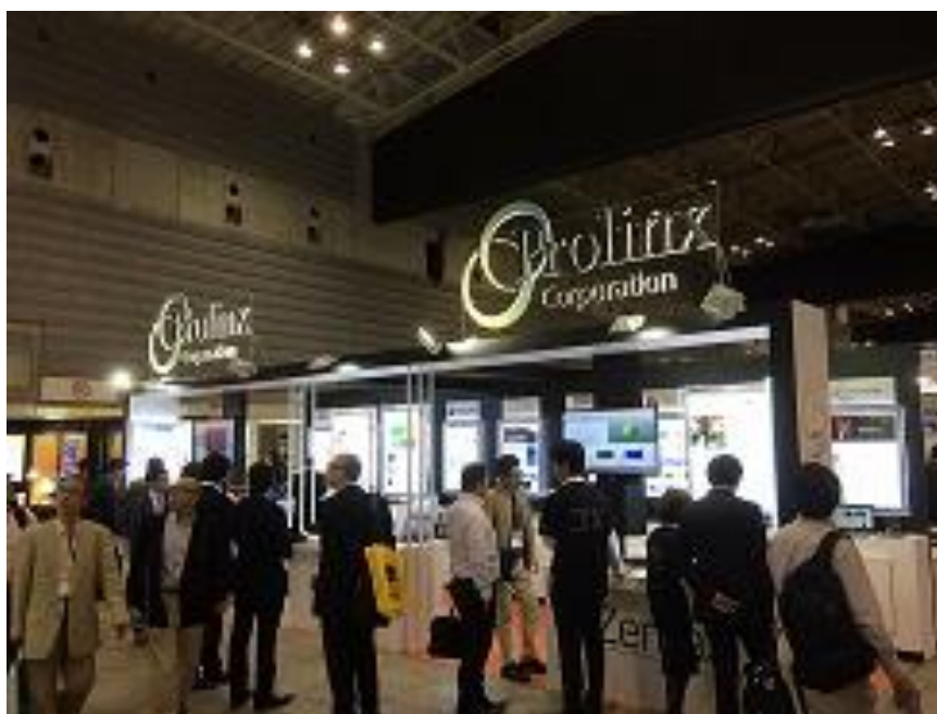
株式会社プロリンクス様 出展ブース