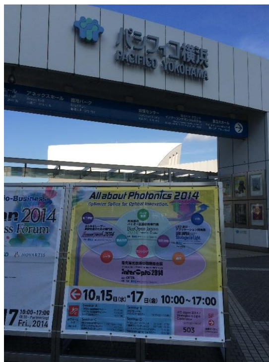
InterOpto 2014 @パシフィコ横浜